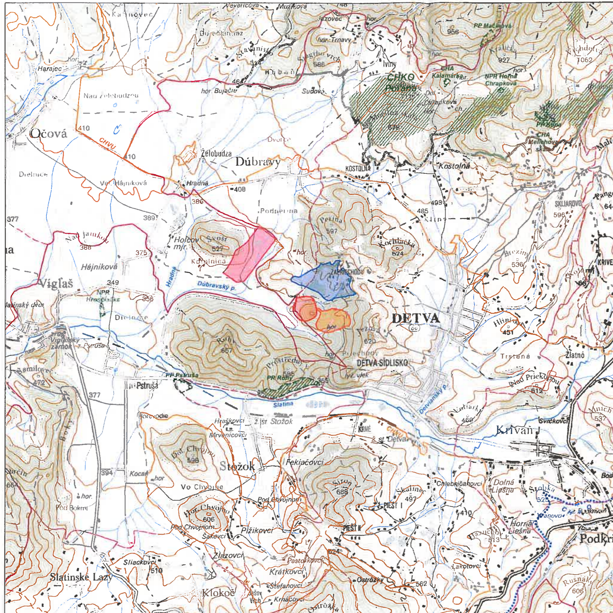
II.6 Prehľadná situácia umiestnenia navrhovanej činnosti (mierka 1 : 50 000) Situation map (Scale 1 : 50 000)